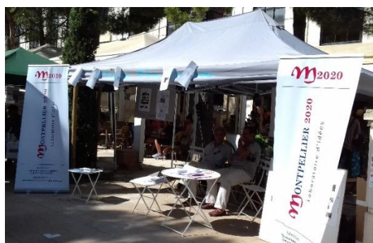
Montpellier 2020 à l'Antigone des associations

MP2020 a tenu son dernier CA de 2017 à la mi-décembre.