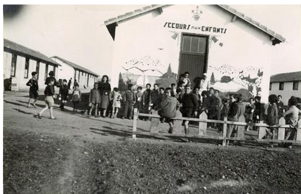
Le camp d'accueil de Rivesaltes ( memorialcamp rivesaltes.eu )

2018 : « un combat au service de notre prochain ... »