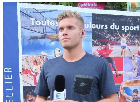
Montpellier hand champion d'Europe en 2003 (handnews.fr) et Kevin Mayer champion du monde de décathlon en 2017 (grand-insep.fr)

Le troisième, auquel je tiens principalement, est relatif aux CENTRES de FORMATION.