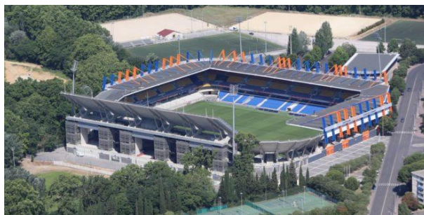
Le stade de la Mosson

L'article de Gérard Dorival rencontre l'actualité des projets des équipes municipales et métropolitaines à propos de deux importants équipements sportifs : le stade de football et le bassin de natation Neptune.