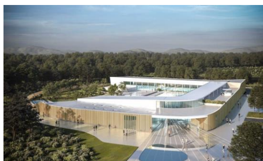
Le projet du Centre Nautique